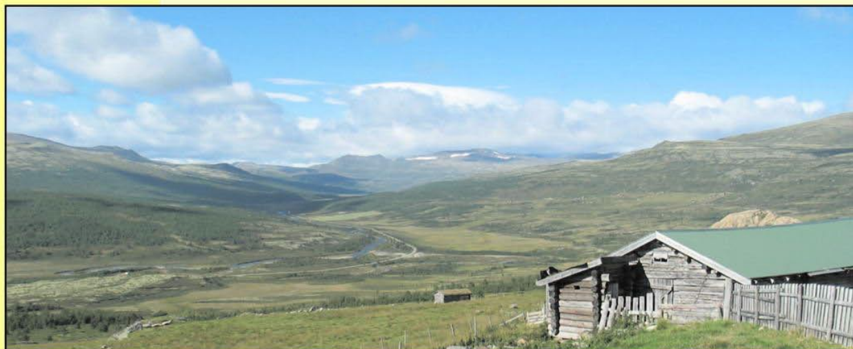
Grimsdalen sett fra Tollefshaugen, Smeltevannsløp over sætertal til høyre. Foto BAF 2006.

Folks bruk av området har satt sitt preg på dalen. Fra Dovre fulgte ferdafolk stier og tråkk (råk) gjennom dalen til Folldal. Her var det arbeid å få i gruvene. Leveranser av mat, tømmer og trekull la grunnlaget for fraktruter gjennom dalen. Med hensyn til utfyllende opplysninger om kulturlandskapet i Grimsdalen vises det til kulturhistorisk rapport Grimsdalen nr 2 -2004.