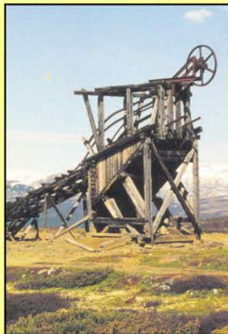
Det gamle gruveløst ved Grdalsgruven.